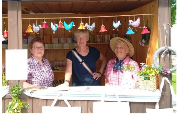
Frauen des Bastelkreises in der Verkaufsbude zum 700-jährigen Jubiläum der Stadt Zöblitz 2023.