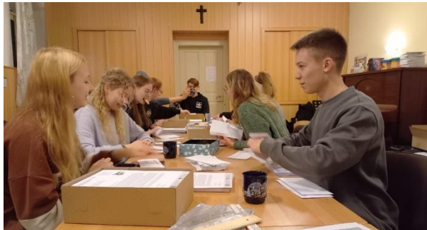
Die Junge Gemeinde beim Falten der Spenderbriefe.

Es ist unfassbar schön zu sehen, wie sich Alt und Jung, kirchennahe und kirchenerne aus dem ganzen Ort an den unterschiedlichsten Stellen eingebracht haben und weiter einbringen. Herzlichen Dank dafür, auch denjenigen, die bisher noch nicht genannt wurden.