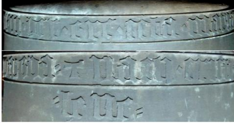
Umschrift auf der Glocke von Zöblitz: „in der ere scta maria (und) magda(lene) T nach cristi geburt m°cccc° lxxvi“