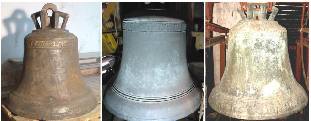
Bild 1: Glocke von Bieberstein links, Zöblitz und Chemnitz rechts

Alle 3 Glocken haben im Bereich der Flanke eine geringe Konizität und sind im Bereich des Wolms weit ausladend. Im Übergang zum Wolm befinden sich mehrere Reifen.