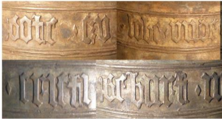
Umschrift auf der Glocke von Bieberstein: „gote zu lobe unde maria nach cristi geburt m°cccc° lxxv“

Beide Inschriften haben sowohl vom Inhalt als auch in der Ausführung der Schrift eine sehr hohe Ähnlichkeit. Auf beiden Glocken werden zur Worttrennung Rhomben verwendet. In den Zahlen werden die „Tausender“ und „Hunderter“ durch hochgestellte „o“ getrennt. Auch selten verwendete Buchstaben wie im Wort „geburt“ sind identisch. Das „t“ hat einen zusätzlichen Abstrich.