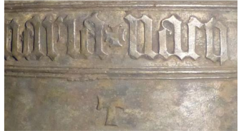
Antoniuskreuz auf der Glocke von Bieberstein.

Das Antoniuskreuz T, typisch für die Glocken von Nicol und Oswald Hilliger, befindet sich auf der Glocke von Bieberstein unterhalb des Schriftbandes, auf der Glocke von Zöblitz im Schriftband.