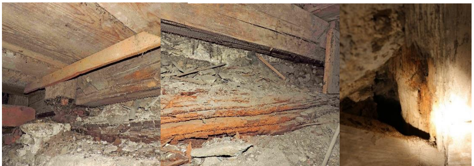
Links und Mitte: Blick auf den Übergang zwischen Holztrag- und Mauerwerk. Rechts: Morsches Fachwerk.